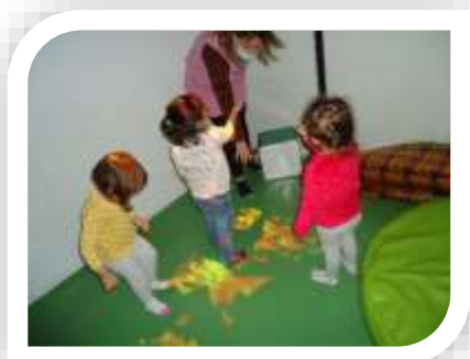
Aula multisensorial EBM La Ginesta

També participa dels claustres quan se li demana i ens fa arribar articles i escrits d'alguna temàtica que ens preocupa a l'hora d'educar el infants que tenim al centre. Tot plegat són petits complements que podem donar des de l'escola per vetllar pel benestar dels infants i acompanyar a les educadores